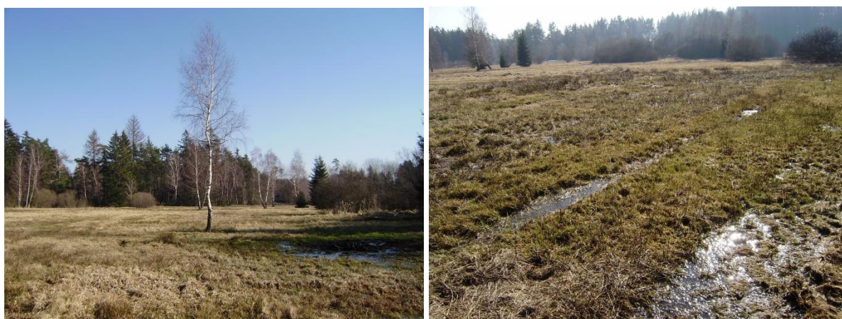
Pohled na rašeliniště v předjaří 2021

Tato rezervace ochraňuje luční rašeliniště s vzácnými druhy rostlin a živočichů. V části, která je nejzamokřenější, rostou keřové vrby a ostřice. V dalších částech rašeliniště se vyskytuje z chráněných rostlin prstnatec májový, rosnatka okrouhlostá, vachta trojlistá, tolije bahenní, kozlík dvoudomý, všivec lesní, hadí mord, suchopýr úzkolistý aj., z náletů pak vrba a bříza bělokorá. Z ptáků v rezervaci hnízdí bekasína otavní, z dalších živočichů se tu vyskytuje čmelák luční, mravenec rašelinný a různé druhy pavouků.