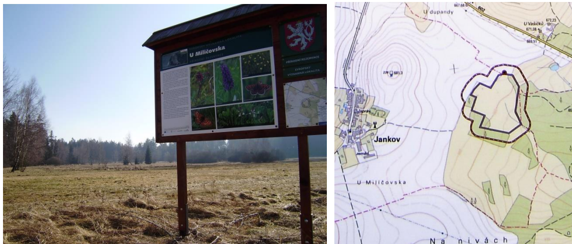
Naučná tabule přírodní rezervace U Milíčovska s mapkou

evropsky významná lokalita v katastru obce Jankov, byla vyhlášena chráněným územím v r. 1993 na ploše 6,1 ha. Nachází se v těsné blízkosti hlavního evropského rozvodí, nedaleko silnice Pelhřimov – Jihlava (proti samotě U Vašíčků), v nadmořské výšce 656-662 m. Patří už k úmoří Černého moře. Leží v mělké pramenné míse přítoků Jedlovského potoka, do kterého se zdejší luční a lesní potůčky a stružky slévají.