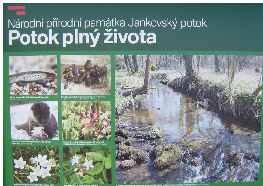
Naučná tabule s označením ohrožených (nebo už vyhynulých) druhů rostlin a živočichů