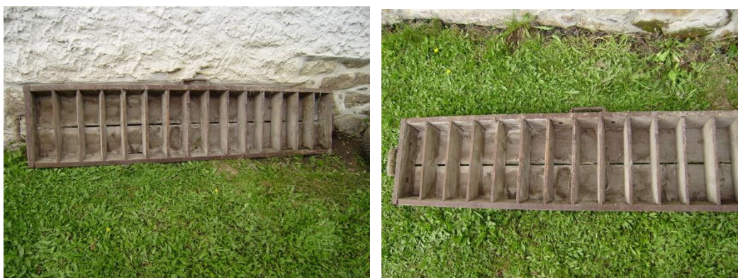
Forma na borky, dochovaná v chalupě č. 14 v Jankově, nyní předaná do muzea v Humpolci.