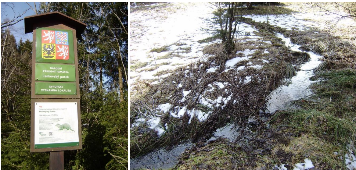
Informační tabule nedaleko prameniště horního toku Jankovského potoka a část meandrujícího toku v přilehlých loukách.

Potřeba chránit mizející tvářnost krajiny a také výstavba vodní nádrže Švihov na Želivce, která se měla stát zásobárnou pitné vody pro Prahu, vedla k vyhlášení zdejší chráněné přírodní rezervace. V letním období po několik sezón kempovali v katastru Jankova ochránci přírody, kteří se pustili do obnovy horního toku Jankovského potoka a pravidelně vyžívali přilehlé louky. I po vyhlášení přírodní rezervace je potřeba o celou údolní nivu Jankovského potoka stále pečovat, a tak brigády na čištění toku, kosení břehů a sklizení posečené trávy pokračují. Ochránci přírody se také pokusili vypustit do potoka perlorodka říční, ale ukázalo se, že její populace už tu není životaschopná.