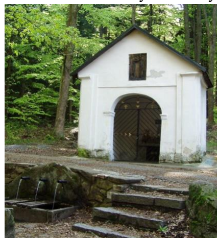
Křemešnická studánka se zázračnou vodou