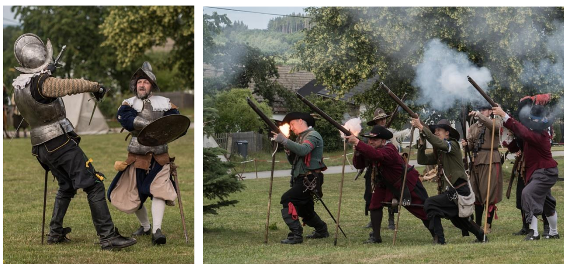
Foto z rekonstrukce bitvy u Branišova z r. 1618 po 400 letech, v r. 2018

Zkáza, kterou přinesla třicetiletá válka zdejšímu kraji, a hrůzy, které tu lidé zažívali, patří k tomu nejhoršímu, co do té doby mohla historie u nás zaznamenat. Počátkem válečných událostí se stal odboj českých nekatolických stavů proti Habsburkům v letech 1618-1620. Jedna z prvních bitev se odehrála nedaleko nás, mezi Branišovem a Vyskytnou, místu se dosud říká „Na Bojišti“. Část císařského vojska vedeného generálem Dampierrem se zde 3. listopadu 1618 utkala s oddíly stavovského vojska hraběte Thurna. Císařská vojska byla poražena a stáhla se. Dokladem o této bitvě je i větší množství koňských podkov a zlomků zbraní, které se nacházely v této lokalitě na polích nebo při dobývání pařezů v lese, mnohé z nich jsou uloženy v muzeu v Pelhřimově. V r. 2018 u příležitosti 400. výročí této bitvy připravila obec Branišov rekonstrukci bitvy za hojné účasti návštěvníků.