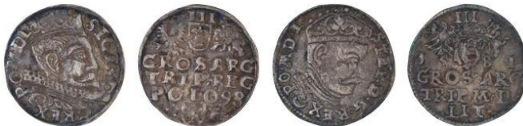
Třigroš krále polského a švédského a velkoknížete litevského Zikmunda III. (1587–1632) vyražený roku 1598, stříbro

Vysočiny v Jihlavě, kde je uložen v numismatických sbírkách. Při důkladném průzkumu místa bylo nalezeno ještě dalších 37 mincí, takže muzeum v současnosti spravuje 711 stříbrných mincí z tohoto pokladu. Poklad si tam mohl uložit nějaký voják (velitel?) přesunujících se jednotek, či nějaký kupec, anebo podle pověsti to je pokladna švédského velitele, který si při rychlém ústupu před císařskými vojsky pokladnu tady zakopal a už se pro ni nikdy nevrátil.