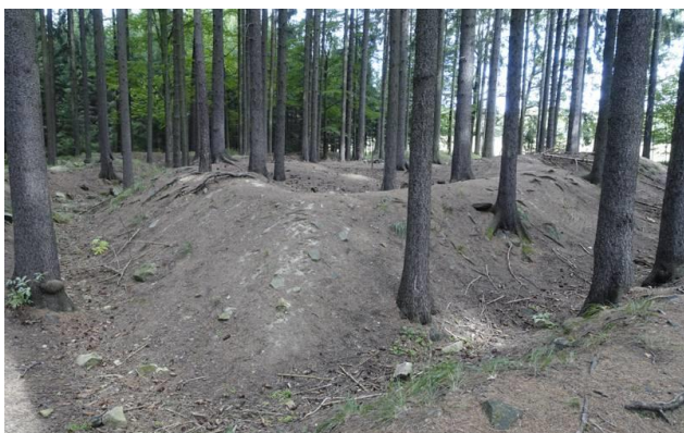
Pozůstatky švédských šancí u Rohozné

Pozůstatky švédského vojenského tábora z doby třicetileté války se dosud nacházejí na okraji lesa mezi Novým Rychnovem a Rohoznou v blízkosti samoty Šance . Pocházejí zřejmě z r. 1640, kdy Švédové vypálili Rychnov. Tábor měl rozměry 50 x 50 m, dva vchody a dvě vysunutá dělostřelecká postavení. Byl vybudován nad cestou vedoucí od Jihlavy přes Čeríněk k Novému Rychnovu, zřejmě měl také kontrolovat tuto cestu. Při této cestě se také v minulosti